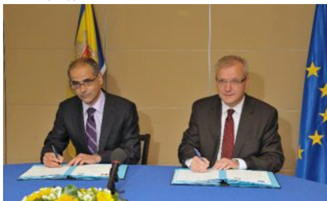
Подписание валютного соглашения главой правительства Андорры Антони Марти (кат. Antoni Martí) и Европейским комиссаром по финансам Олли Реном (англ. Olli Rehn), 30 июня 2011 года, Брюссель

30 июня 2011 года валютное соглашение между княжеством Андорра и Европейским союзом было, наконец, подписано.