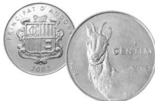
Пиренейская серна на 1 сантиме 2002 года Андорры, алюминий, диаметр - 27 мм, масса - 2.1 г

Серны отлично приспособлены для жизни в горах, они очень проворные и ловкие. Если они встревожены, то могут взобраться на крутой каменистый склон и прыгать вверх на высоту до 2 м.