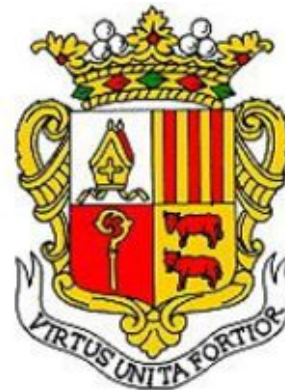
Французский вариант герба Андорры с 1931 до 1969 года

В 1931 году была принята новая четырёхчастная французская версия герба - епископские митра и посох были помещены раздельно в левые четверти гербового щита, а символы французского правления - в правые. Внизу появилась девизная лента.