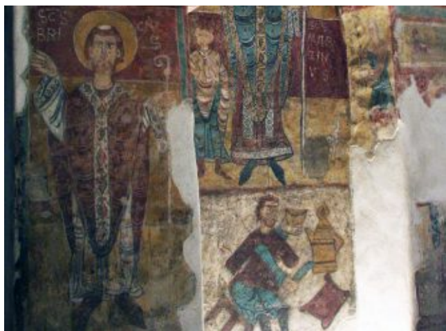
Фреска Святой Мартин Кортинадский, ок. 1140 - 1160 гг., церковь Святого Мартина, Андорра

Министр финансов Андорры Хорди Синка заявил, что правительство княжества сочло просьбу Европейского союза «разумной и обоснованной» и решило изменить первоначальный вид монет, заменив образ Святого Мартина Кортинадского на монетах достоинством 10, 20 и 50 евроцентов изображением мавританской арки из ограждения церкви Святой Коломы.