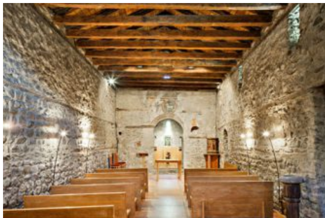
Внутренний интерьер церкви Святой Коломы

Церковь была заложена в IX-X веках. Однако за время своего существования её изначальный облик сильно изменился. Основные работы по реконструкции церкви были проведены в XII веке. Именно в этот период была построена единственная круглая колокольня в княжестве, а внутренний интерьер церкви украшен романскими фресками, выполненными местным мастером.