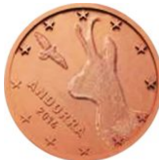
1, 2, 5 евроцентов