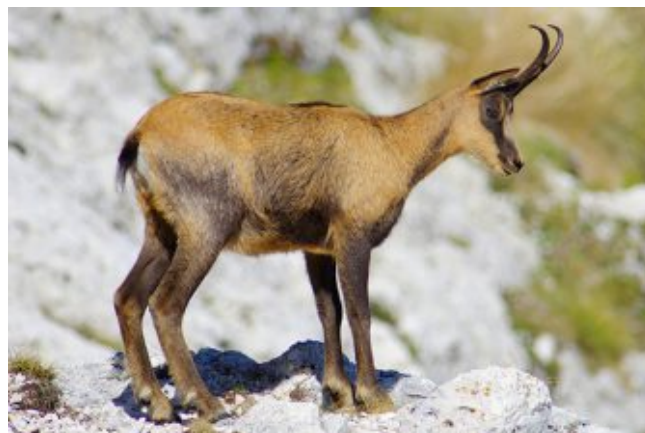
Пиренейская серна ( Rupicapra pyrenaica pyrenaica )

Пиренейские серны (лат. Rupicapra pyrenaica pyrenaica ) - вид из семейства полорогих, подсемейства козлов. Размеры серны составляют примерно один метр в длину и 75 см в холке. Вес взрослого животного - от 30 до 50 кг. Имеет компактное и сильное телосложение со стройной шеей, короткой мордой и острыми ушами. У серны длинные стройные ноги с плоскими копытами, а также изогнутые назад рога, достигающие 25 см в длину и прищипанные обоим полам.