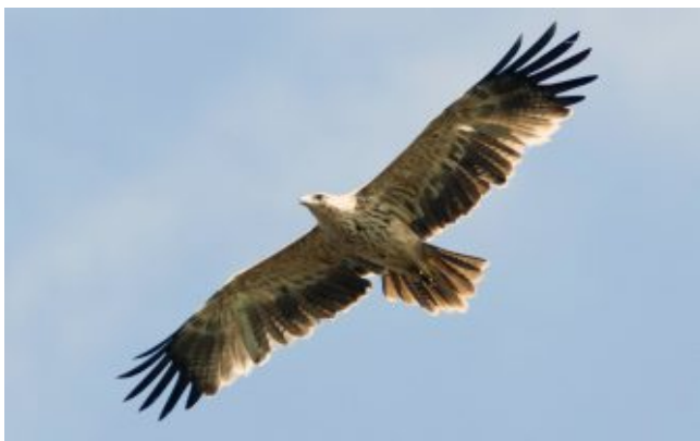
Королевский орёл ( Aquila adalberti )

Королевского или Солнечного орла (лат. Aquila heliaca ) в научном мире называют орёл-могильник. Это название орёл получил в XVIII веке после экспедиций русских исследователей в Казахстане, где его постоянно встречали на деревьях, растущих около мавзолеев в степи. В Европе он известен как королевский орёл. Популяция Пиренейского полуострова, которую ранее традиционно рассматривали в качестве одного из подвидов могильника, в настоящее время обычно выделяется в самостоятельный вид испанский могильник (лат. Aquila adalberti ).