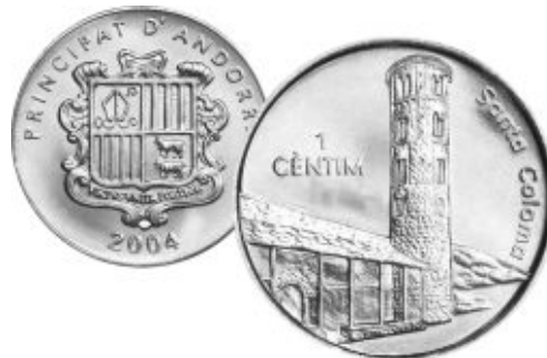
Церковь Святой Коломы на 1 сантиме 2004 года Андорры, алюминий, диаметр - 27 мм, масса - 2.1 г

До наших дней из оригинального убранства мало что сохранилось. Большинство ценных предметов было вывезено за пределы Андорры и на сегодняшний день они хранятся в Берлинском музее. Из внутреннего декора сохранились фрагменты изображения Агнца Божьего, находящегося в окружении двух ангелов, резная фигура Девы Марии Спасительницы из полихромного дерева (XII - XIII век) и барочное ретабло (XVIII век) Святой Коломы, покровительницы церкви. Также в церкви имеется средневековый алтарь, выполненный в стиле барокко. Весь потолок церкви выполнен из дерева, которое сохранилось, практически в первозданном виде.