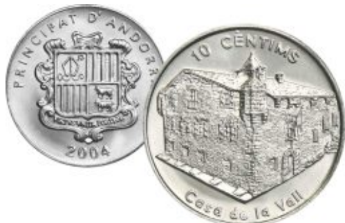
Дом Каса-де-ла-Валь на 10 сантимах 2004 года Андорры, сталь плакированная никелем, диаметр - 27.8 мм, масса - 7.8 г

В саду перед зданием установлена скульптура, созданная скульптором Френсисом Вилодоматом, изображающая национальный танец.