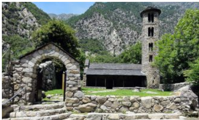
Церковь Святой Коломы, Санта-Колома, Андорра

Основным строительным материалом церкви является серый камень. Как и большинство архитектурных сооружений того времени, она больше похожа на крепость, которую дополняет колокольня цилиндрической формы с окнами-проёмами, напоминающими бойницы и крышей в виде конуса. Экстерьер церкви не имеет архитектурного декора, всё просто и аскетично.