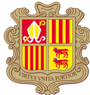
Государственные флаг и герб княжества Андорра

Карликовое государство, расположенное в восточных Пиренеях между Францией и Испанией. Административно делится на 7 parroquies (общин).