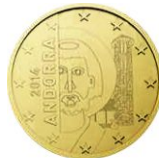
10, 20, 50 евроцентов