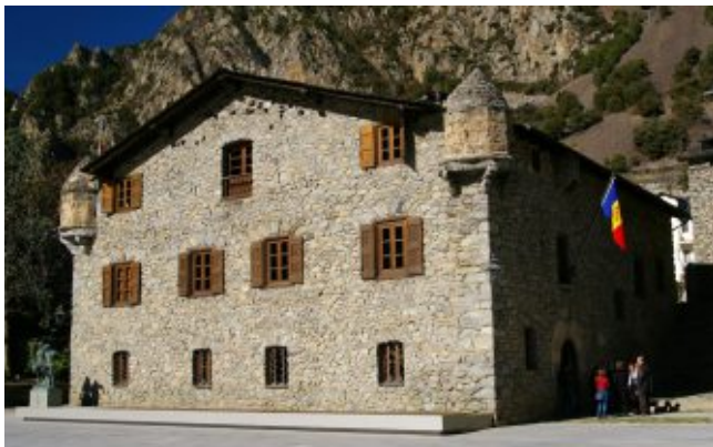
Дом Каса-де-ла-Валь, Андорра-ла-Велья, Андорра

Здание, построенное из необработанного камня, является ярким примером сельской каталонской архитектуры Андорры. Двухэтажный дом с мансардой имеет прямоугольную форму и некоторые элементы оборонительных сооружений, таких как бойница, зубчатые стены и небольшие окна со стальными решетками. На фасаде здания над дверью помещены старинный герб княжества и современные гербы семи parroquias Андорры.