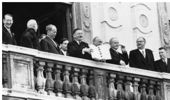
Около 12 часов 15 мая 1955 г. Министр иностранных дел Австрии продемонстрировал собравшимся в саду дворца Бельведер подписанный договор и объявил «Австрия свободна!»

Ещё в 1943 году на встрече в Москве руководители СССР, Великобритании и США объявили о своём намерении воссоздать Австрию как независимое и демократическое государство. Однако с 1945 года, после освобождения Австрии от войск фашистской Германии, и до 1955 года территория Австрии была поделена на оккупационные зоны, в которых размещались войска союзников.