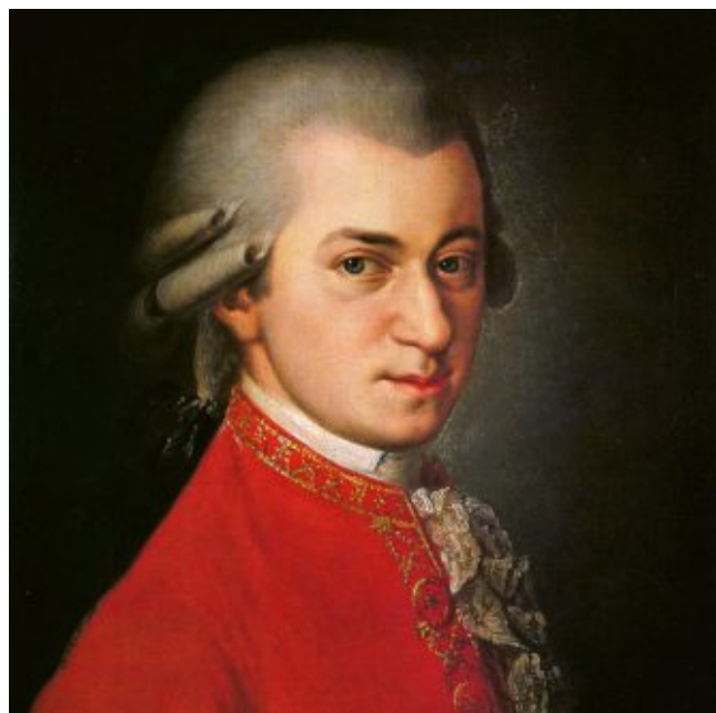
Портрет Моцарта (фрагмент), художник Барбара Краффт, холст, масло, 1819 год, Дом Музыки, Вена

Родился в Зальцбурге, бывшем тогда столицей независимого архиепископства. Занятия музыкой начал под руководством отца - Леопольда Моцарта - одного из ведущих европейских музыкальных педагогов того времени.