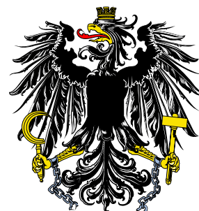
Государственные флаг и герб Австрийской Республики

Государство в центре Европы. Австрия является федерацией восьми земель и приравненного к ним в административном отношении города Вена.