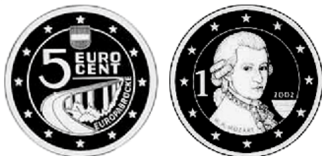
Не утверждённый проект 5 евроцентов с изображением «Моста Европы» через перевал Бреннер и предварительный утверждённый проект 1 евро

На первом этапе были отобраны, представленные для участия в общеевропейском конкурсе от Австрии, проекты общей стороны монет евро. Для участия во втором этапе конкурса на оформление национальной стороны монет евро Австрии были приглашены австрийские художники, участвовавшие в общеевропейском конкурсе.