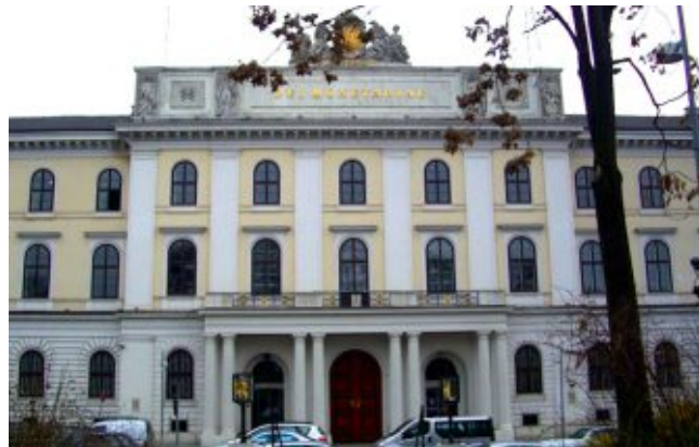
Монетный двор Австрии, Вена

Первый монетный двор был основан в Вене при дворе герцога Леопольда V около 1194 года. Поводом для его создания послужило большое количество серебра, поступившее в герцогскую казну в качестве выкупа за освобождение, схваченного в 1193 году на территории современной Вены, английского короля Ричарда I Львиное Сердце.