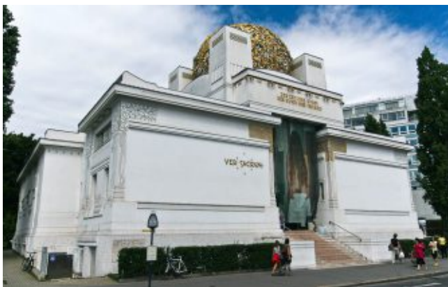
Здание выставочного павильона венского Сецессиона, Вена

В 1898 году членом объединения Сецессион Йозефом Мария Ольбрихом, на предоставленном городом земельном участке на улице Винцайле (нем. Wienzeile ) был построен выставочный павильон для проведения выставок венских художников-модернистов, который венцы также сокращённо называют «Сецессионом».