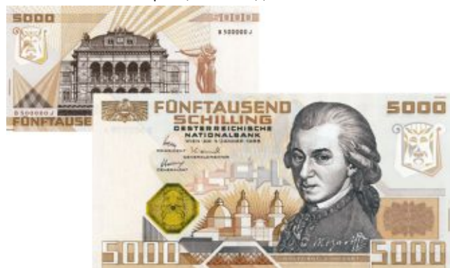
Моцарт на банкноте 5000 шиллингов Австрии, образец 1988 года, 160 x 78 мм

Изображение Вольфганга Амадея Моцарта на монете достоинством 1 евро выполнено с классического портрета композитора, написанного в 1819 году австрийской художницей Барбарой Краффт (нем. Barbara Krafft , 1.04.1764 г. - 28.09.1825 г.). Также портрет Моцарта ранее использовался на австрийской банкноте достоинством 5000 шиллингов образца 1988 года.