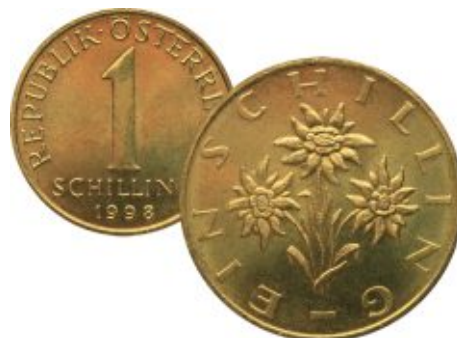
Альпийский эдельвейс на 1 шиллинге Австрии, 1959 - 2001 гг., медно-алюминиевый сплав, 22,5 мм, 4,2 г

Так в оформлении монеты достоинством 2 евроцента использовано изображение альпийского эдельвейса, который ранее изображался на монете достоинством 1 шиллинг, находившейся в обращении с 1959 года.