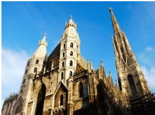
Собор Святого Стефана, Вена

От этого строения сегодня сохранились огромные арочные ворота с башнями по обеим сторонам от них. 7 апреля 1359 года Рудольф IV заложил на месте современной южной башни первый камень новой, готической церкви. В 1433 году постройка южной башни была завершена, а в 1455 году сооружён неф церкви. Постройка северной башни, заложенной в 1450 году, была прекращена в 1511 году и так и осталась недостроенной.