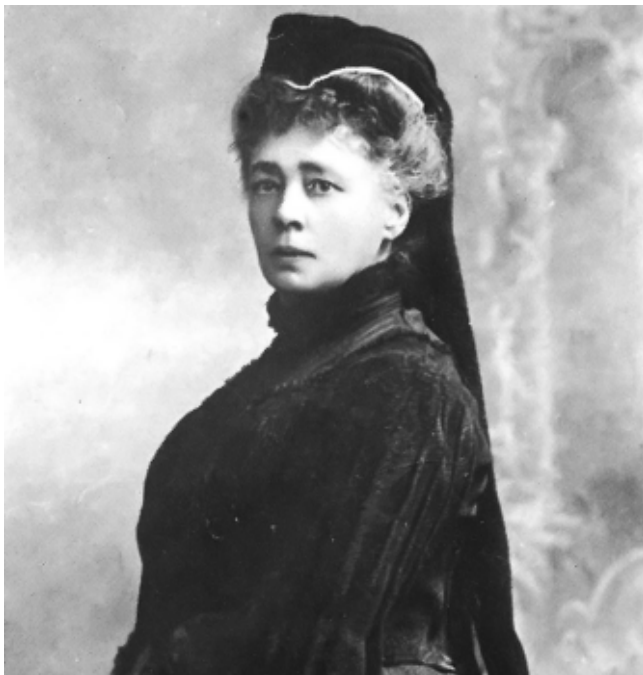
Фотография баронессы Берты фон Зутнер (фрагмент), 1906 год