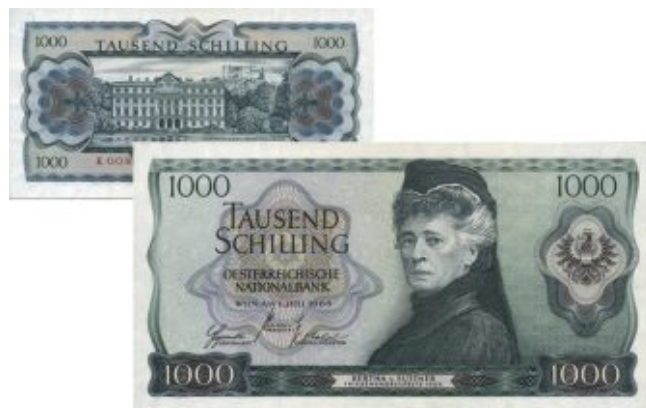
Берта фон Зутнер на банкноте 1000 шиллингов Австрии, образец 1966 года, 158 x 84 мм

На монете достоинством 2 евро изображён портрет баронессы Берты фон Зутнер, аналогичный портрету, использовавшемуся на банкноте достоинством 1000 шиллингов образца 1966 года, который, в свою очередь, был выполнен с фотографии баронессы, сделанной австрийским фотографом Карлом Пецнером (нем. Carl Pietzner , 9.04.1853 г. - 24.11.1927 г.) в 1906 году.