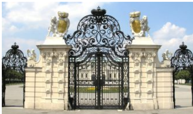
Главные ворота дворцового комплекса Бельведер, Вена

После смерти принца, его наследница продала замок Габсбургам. Иозеф II разместил здесь в 1777 году императорскую картинную галерею. В 1806 году сюда прибыла коллекция из замка Амбрас (Тироль, Бавария). В верхнем Бельведере с 1894 года жил престолонаследник эрцгерцог Франц Фердинанд (именно его смерть в Сараево в 1914 году послужила формальной причиной начала Первой мировой войны).