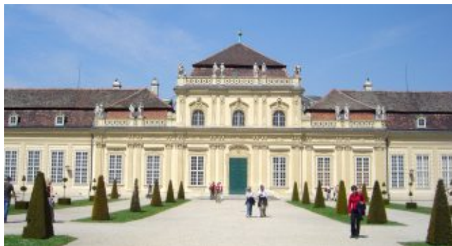
Здание Нижнего Бельведера, Вена

Верхний Бельведер служил принцу в качестве представительской резиденции, Нижний Бельведер - в качестве летней жилой резиденции.