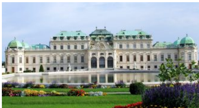
Здание Верхнего Бельведера, Вена

После смерти принца, его наследница продала замок Габсбургам. Иозеф II разместил здесь в 1777 году императорскую картинную галерею. В 1806 году сюда прибыла коллекция из замка Амбрас (Тироль, Бавария). В верхнем Бельведере с 1894 года жил престолонаследник эрцгерцог Франц Фердинанд (именно его смерть в Сараево в 1914 году послужила формальной причиной начала Первой мировой войны).