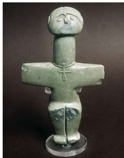
Помосский идол, Археологический музей, Никосия, Кипр

Позднее были найдены предметы эпохи среднего и позднего неолита (IV - III тысячелетия до н.э.). В этот период появилась посуда, сделанная из глины и предметы украшения - бусы из раковин, амулеты и крестообразные идолы. Однако, несмотря на значительное количество образцов древнего искусства, найденных на Кипре, до настоящего времени происхождение древнейших племён, живших на Кипре, достоверно не известно. Предполагают, что первые жители острова пришли на него из Малой Азии.