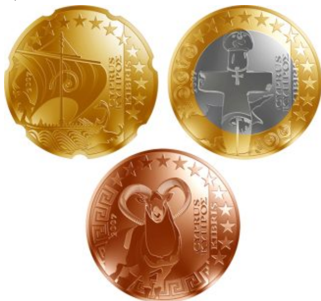
Один из 46 проектов, представленных на конкурс

Приём работ осуществлялся до 14 октября 2005 года. Всего на рассмотрение поступило 46 проектов оформления национальной стороны монет евро Кипра из различных стран мира, среди которых к началу 2006 года комиссией Центрального банка Кипра был выбран победитель. 15 сентября 2006 года, после завершения всех процедур разработки проекта национальной стороны монет евро, окончательный проект был направлен на согласование в Европейский центральный банк и Еврокомиссию.