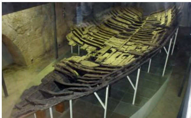
Судно «Кирения», Киренийский замок, Северный Кипр

В течении 1970 - 1974 годов археологи скрупулёзно восстанавливали судно. Его длина оказалась 14,3 м, ширина - 4,3 м. Киль изготавливался из скального дуба, шпангоуты - из чёрной акации, обшивка - из красного бука. Для мачты, реи и вёсел использовали алеппскую ель, корпус был покрыт свинцом для защиты судна от средиземноморского морского червя. Судно было беспалубным, несло один парус, управлялось двумя рулевыми веслами. Для защиты от волн борта наращивали решёткой из толстых прутьев, обтянутых кожей. Останки судна «Кирения» считаются самыми древними останками из найденных до сих пор судов.