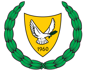
Государственные флаг и герб Республики Кипр

Государство, расположенное на острове в северо-восточной части Средиземного моря, к югу от Турции. Разделяется на 6 районов, 2 из которых являются турецкими секторами, 3 - греческими, а город Никосия разделён между греческим и турецким секторами.