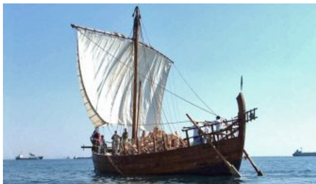
Судно «Кирения II»

В 1985 году на Кипре и в 1988 году в Японии были построены полноразмерные копии судна, получившие названия «Кирения II» и «Кирения III» соответственно. В 2002 году к Олимпийским играм 2004 года была построена третья копия судна «Кирения Либерти», которое доставило в Афины символический груз меди для олимпийских медалей.