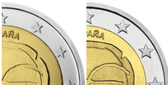
Монеты с обычным размером звёзд

В центре внутреннего диска расположена композиция, выполненная в примитивистском стиле: на поверхности в форме старинной монеты расположено стилизованное изображение человека, держащего в левой руке знак «€», символизирующая валюту евро, как новейший шаг в долгой истории развития торговли - от доисторического товарообмена (рисунок человека), до экономического и валютного союза (знак евро), справа внизу расположен знак художника монеты (аббревиатура «ГΣ»), слева сверху от изображения расположен знак монетного двора Испании (литера «М», увенчанная короной), над изображением полукругом расположено название государства, выпустившего монету «ESPAÑA» («ИСПАНИЯ»), под изображением полукругом - надпись «UEM 1999-2009» («ЭВС 1999-2009», сокр. от исп. Unión Económica y Monetaria (экономический и валютный союз)). Все надписи на монете выполнены на государственном языке Испании - испанском. На внешнем кольце равномерно по кругу расположено 12 звёзд. По окружности монета имеет выступающий кант.