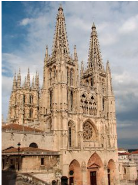
Кафедральный собор, город Бургос

На внутреннем диске расположено изображение Кафедрального собора Богоматери в городе Бургос, слева сверху полукругом расположено название государства, выпустившего монету «ESPAÑA» («ИСПАНИЯ»), справа - год выпуска монеты «2012» и знак монетного двора Испании (литера «М», увенчанная короной). На внешнем кольце равномерно по кругу расположено 12 звёзд. По окружности монета имеет выступающий кант.