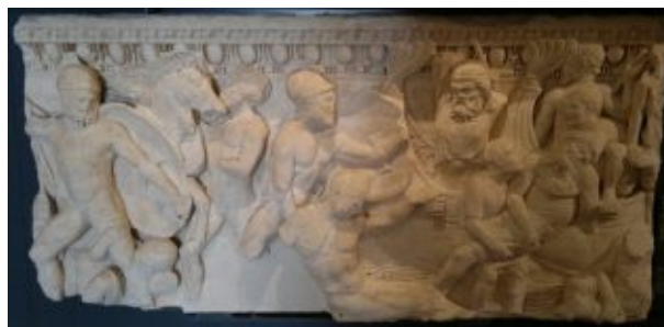
Фрагмент римского саркофага с единственной дошедшей до нашего времени достоверной сценой битвы при Марафоне, изображающей отход персов на корабли, II век н.э., музей Санта-Джулия (Брешиа, Италия)

Основным источником, описывающим битву при Марафоне, является VI книга «Истории» Геродота, согласно которой армия персидского царя Дария I под руководством военачальников Датиса и Артаферна после успешной кампании по покорению городов Наксоса и Эретрии высадилась в бухте около города Марафон. Силы персов составляли около 25000 пеших воинов и 1000 всадников, что тем не менее не помешало десяти тысячному объединённому войску афинян и платейцев под руководством полемарха Каллимаха и стратега Мильтиада одержать сокрушительную победу над врагом, потеряв убитыми 192 грека против 6400 персов и вынудив тех спастись бегством на кораблях. В этом сражении греки применили тактику двойного охвата (эта тактика известна по битве при Каннах, в