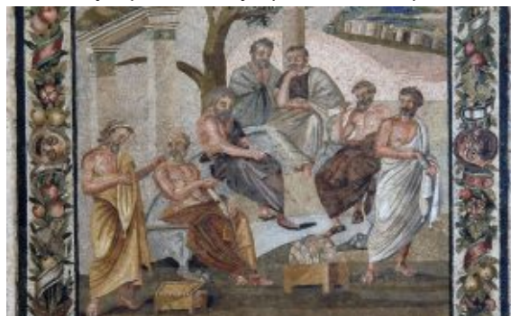
Мозаика из Помпей «Платоновская академия», I век до н.э., Археологический музей, Неаполь

В дальнейшем Платоновская академия пережила несколько этапов своего развития - «средняя» и «новая» академии, развивавшие в качестве основного учения скептицизм, а также 4-я и 5-я академии, объединившие в своих учениях элементы трудов Платона и Аристотеля с пифагорейством и восточными учениями. В 529 году декретом византийского императора Юстиниана I были закрыты все философские школы в Афинах. Платоновская академия, пройдя за 916 лет периоды процветания, упадка и возрождения, также прекратила своё существование.