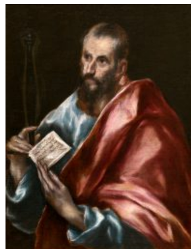
«Святой Апостол Павел», Эль Греко, 1610 - 1614 гг., Музей Прадо, Мадрид

В 1576 году Эль Греко прибыл в Испанию. Однако испанскому королю Филиппу II пришлось не по вкусу новизна и необычность картин Эль Греко и в 1577 году он поселился в Толедо - центре испанского просвещения и искусств того времени. Его работа в соборе Толедо была благожелательно принята в испанских религиозных кругах и повлекла за собой множество крупных заказов. Именно в Толедо художник создал наиболее известные свои картины. Сведущий во многих областях