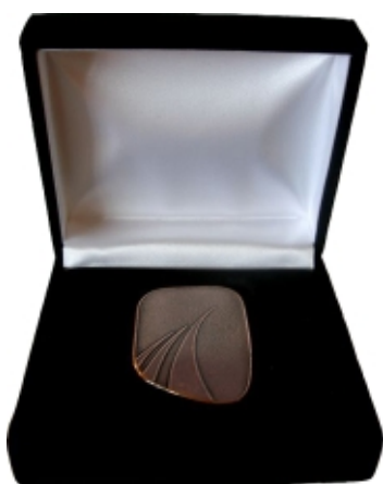
Бронзовая награда Президентской Премии Gaisce

Премия Gaisce (ирл. «достижение») - национальная премия под патронажем Президента Ирландии. Премия была учреждена 28 марта 1985 года и является частью Премии герцога Эдинбургского. Это самая престижная и уважаемая в Ирландии программа индивидуальных поощрительных вознаграждений, разработанная для молодых людей в возрасте от 15 до 25 лет за личное развитие вне зависимости от своего происхождения, участвующих в ряде мероприятий в течении определённого периода времени. Лучшие участники программы награждаются бронзовой, серебряной или золотой наградой.