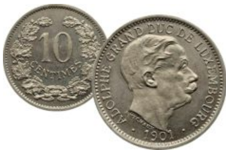
Портрет Великого Герцога Адольфа на 10 сантимах 1901 года, медно-никелевый сплав, диаметр 20 мм, художник - Alphonse Michaux

В центре внутреннего диска расположены профильные портреты Великого Герцога Люксембурга Анри, за ним - Великого Герцога Люксембурга Адольфа, на обрете шеи портретов Анри и Адольфа расположены знаки авторов портретов (аббревиатуры «GC» и «EV»), под портретом Анри расположены надписи в две строки «HENRI» («АНРИ») и год рождения «† 1955», под портретом Адольфа - «ADOLPHE» («АДОЛЬФ») и год смерти «† 1905», над портретами расположена надпись полукругом «- GRANDS-DUCS DE LUXEMBOURG -» («- ВЕЛИКИЕ ГЕРЦОГИ ЛЮКСЕМБУРГА -»). На внешнем кольце равномерно по кругу расположены 12 звезд, чередующихся с буквами названия государства, выпустившего монету «LËTZEBUERG» («ЛЮКСЕМБУРГ»), внизу расположен год выпуска монеты, разделённый звездой на две части «20» и «05», слева и справа от года расположены знаки монетного двора Финляндии (литера «S» и стилизованный рог изобилия). По окружности монета имеет выступающий кант.