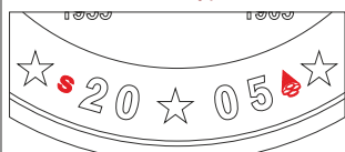
Оригинальный выпуск 2005 года на монетном дворе Финляндии

Знаки монетных дворов на памятных монетах Люксембурга достоинством 2 евро 2005 года